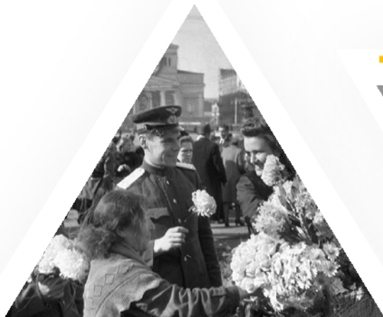
Цветы памяти Парады на Дальнем Востоке